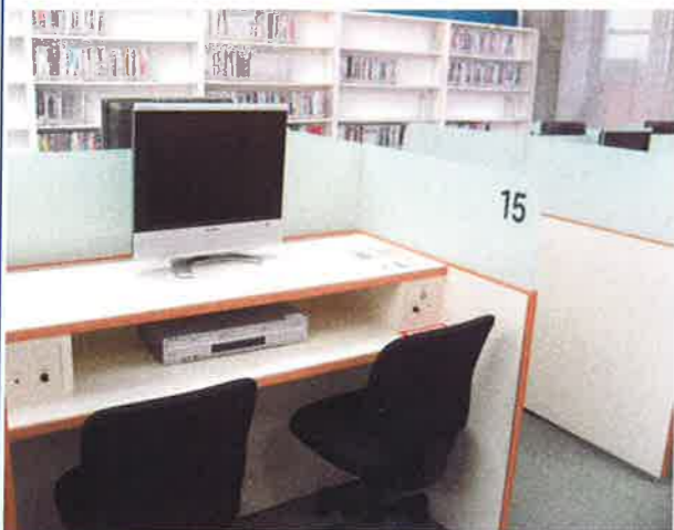
↑専用の視聴ブース

本学図書館の特長の1つといえば、DVDなどの視聴覚資料の多いことが挙げられます。 また、その種類についてもメジャーなものから、少しコアなものまで各種取り揃えております。 どんな資料があるのかは、実際に図書館に来て確認してみてくださいね。 毎年、新入生が図書館に来ると、「TSUTAYAさんみたい！すごい！」と驚かれますが、残念ながら館外への貸出は出来ません。専用の視聴ブースがあるので、そちらをご覧ください。 授業と授業の合間など、時間を有効に使って、卒業までにたくさん見てくださいますね。